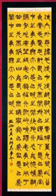
「徐三出師表」後藤夢介 埼玉県立大宮光陵高等学校