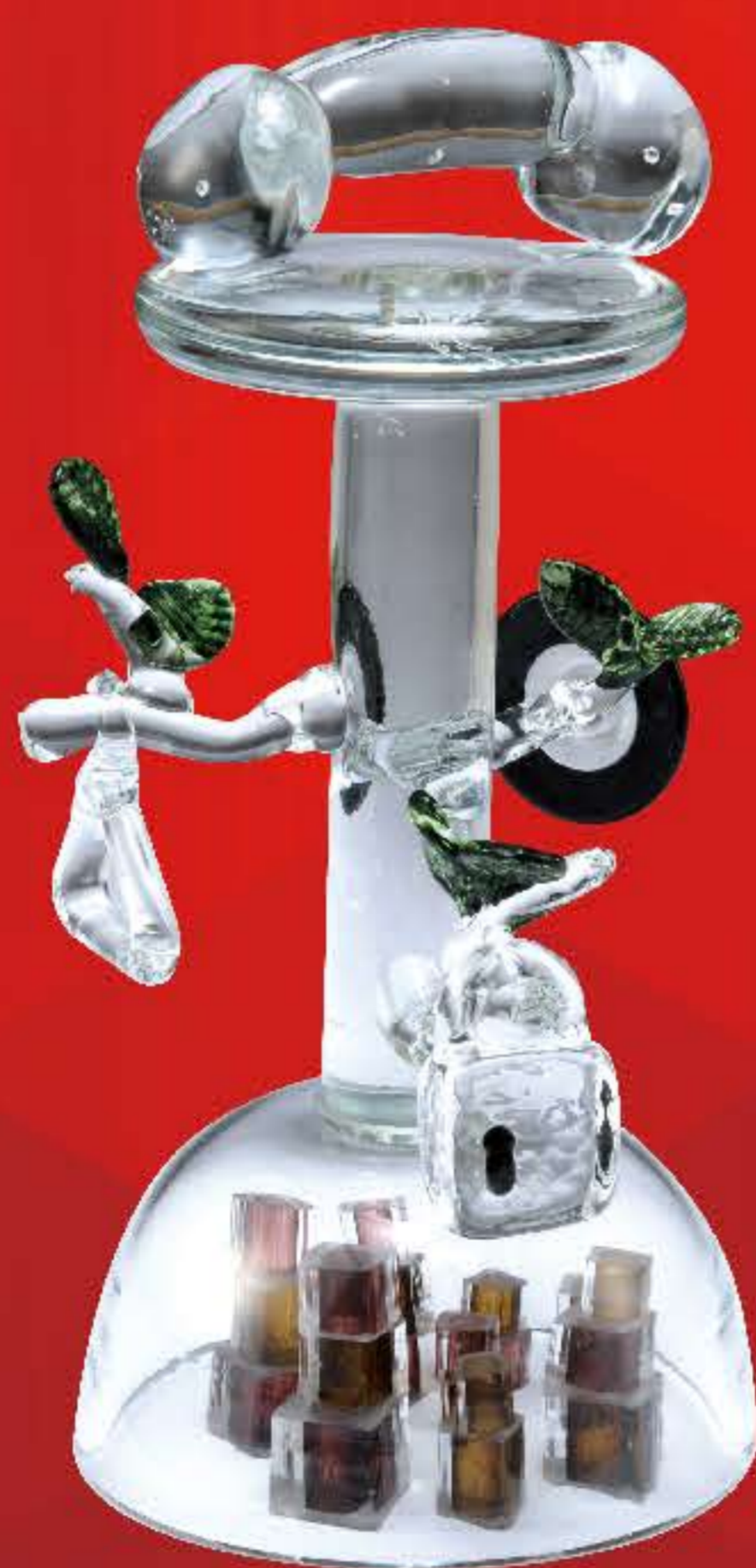
「ゆりかご」野島胡々 金蘭会高等学校