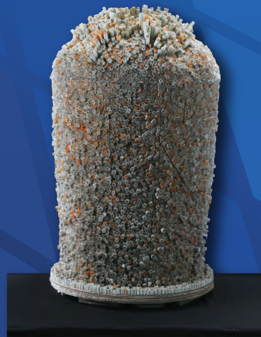
2014年度 文部科学大臣賞「宙のすみか」愛媛県立松山高等学校 3年 青井 星朗

※ WEB上で簡単に「QRコード入り出品票」を作成できます。 詳しくは、ホームページ ( http://www.ihsaf.net ) をご覧下さい。