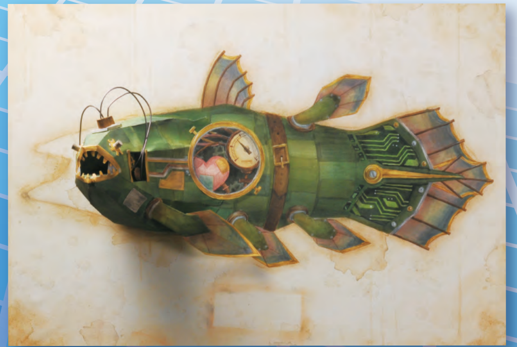
2014年度 内閣総理大臣賞「宿る」岩手県立盛岡第四高等学校 3年 福島 志保