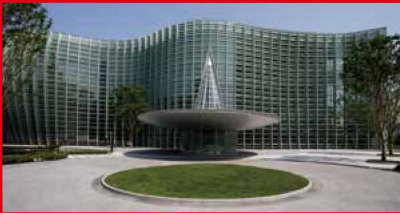
展示会場 国立新美術館

水流開於法性舟泛表於 慈航塔現兆於有成燈明 示於無盡非至德精感其 孰能與於此及禪師建言 雜然歡愜負荷荷插于藜 于囊登登憑憑是板是築 多寶塔研 福原万葉院