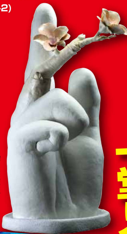
【密いばかり】 埼玉県立山口高等学校2年 増尾 空花